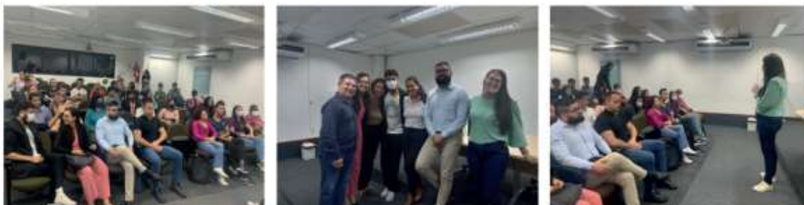
Figura 20: O Corecon-RN participa da semana de integração dos alunos do curso de ciências econômicas da UFRN, semestre 2022.2.