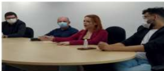
Figura 18: Participação do Corecon-RN e economistas filiados na semana de integração de recepção dos alunos do curso de economia, UFRN, semestre 2022.1.

Corecon-RN encerra participação na SEMANA DE INTEGRAÇÃO com Roda de Conversa com calouros de economia