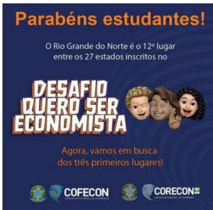
Figura 21: Divulgação do “Desafio quero ser economista”.