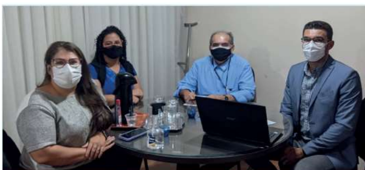
Figura 3: Reunião com Assessoria Jurídica