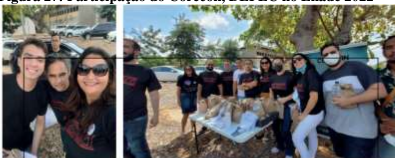
Figura 27: Participação do Corecon, DEPEC no Enade 2022