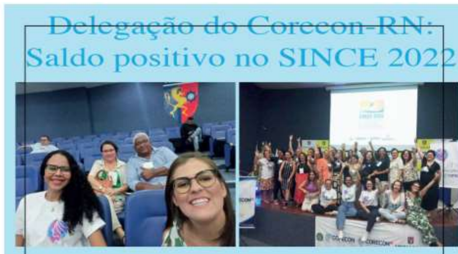
Figura 26: Delegação do CORECON-RN no Since 2022